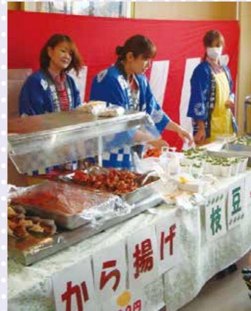
職員が売子になって販売