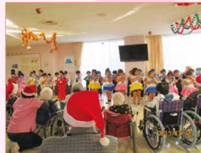
新富士ケアセンター