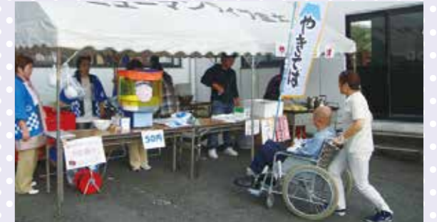
焼きそば屋さん「ふくしま」さん