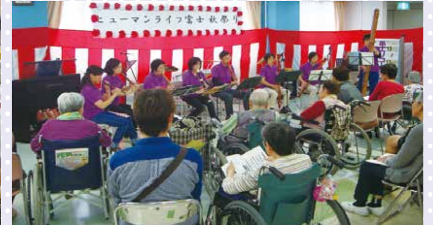
富士リコーダーオーケストラによる演奏