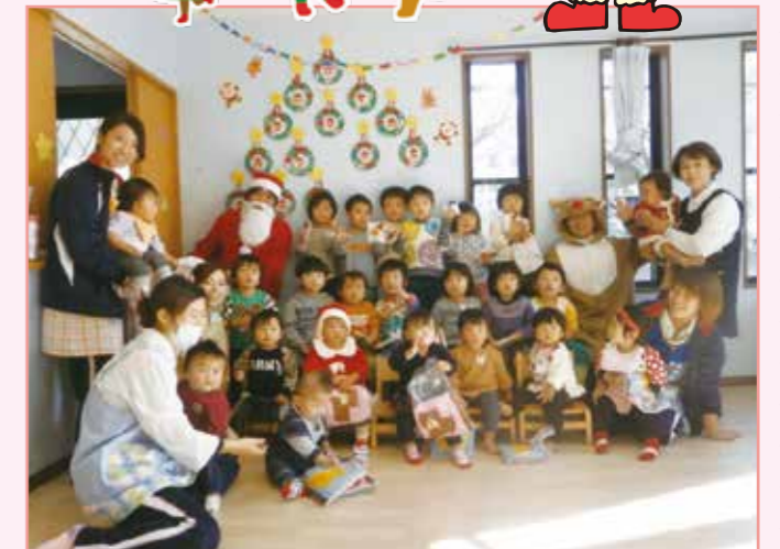
保育所「ぶちっこ園」