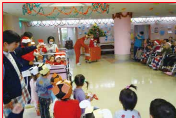
↑小さなサンタさんをお出迎え。