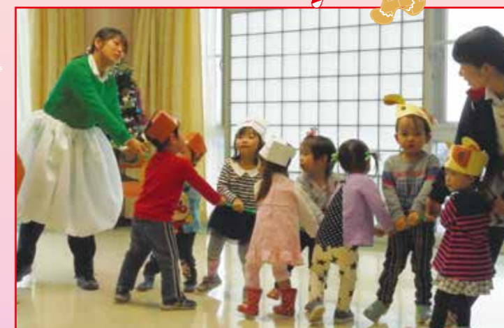
↑大きなカブの劇を見せてくれました。

新富士ケアセンターへ、ぶちっこ園の みんなが遊びに来てくれました。 劇や歌でクリスマス会を盛り上げて くれました。